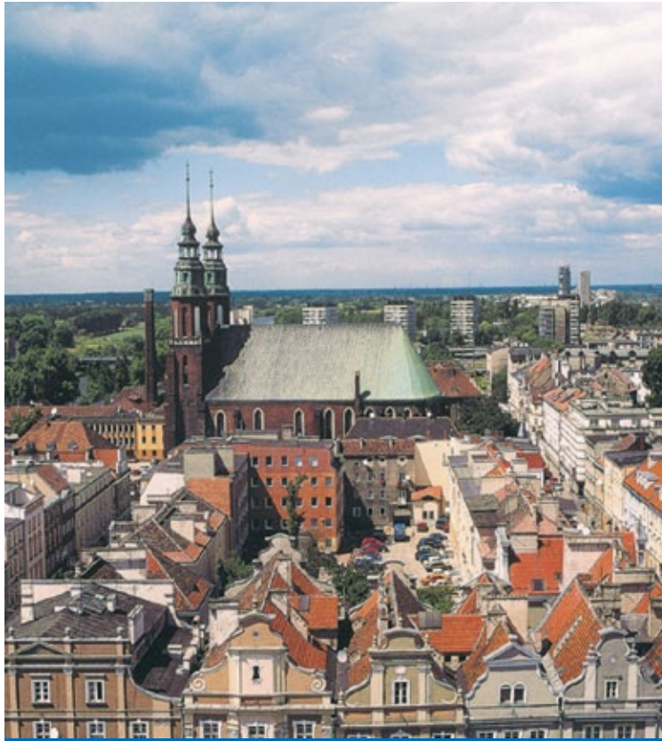
Widok na Ratusz w Opolu