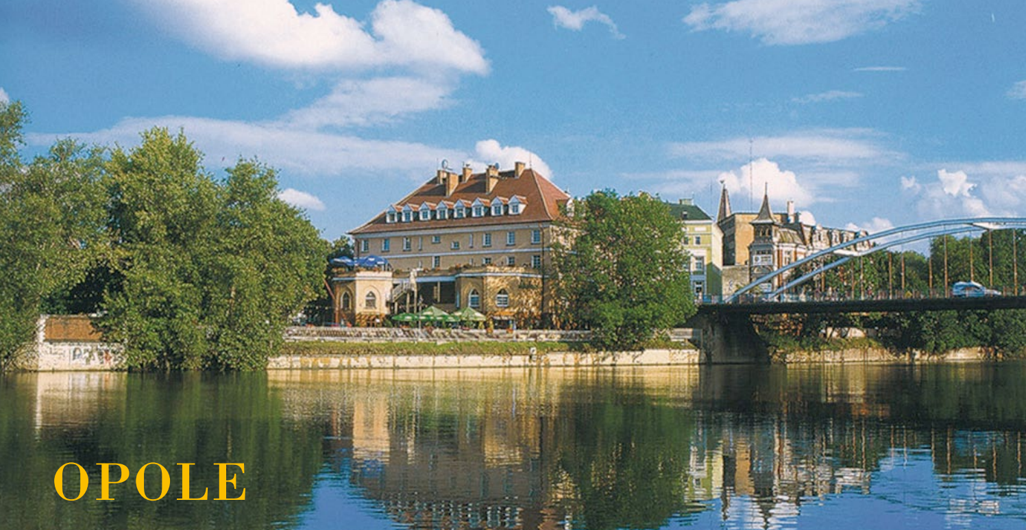
Hotel Piast w Opolu

To jest najstarsze partnerstwo Poczdamu. Pierwsze kontakty pomiędzy Opolem a Poczdamem zaczęły się w latach 60-tych. W 1973 r. nastąpiło podpisanie oficjalnej umowy o partnerstwie obu miast.