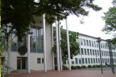
Bundesrechnungshof an der Adenauerallee