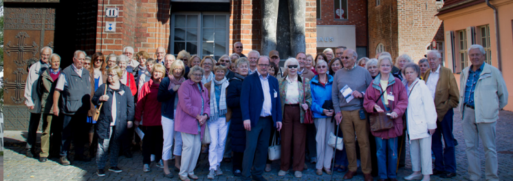
Potsdam-Club und Bonn-Club: Bürgerbegegnung Tag der Deutschen Einheit 2016