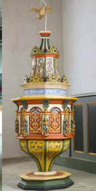
Taufe von 1638, überarbeitet 1681, vor und nach der Restaurierung: Fotos: Janko Barthold/Hans Bach

doxie jener Zeit und zeugt von der ersten großen Neugestaltungswelle in den Kirchen der zweiten Generation nach der Reformation in Brandenburg.