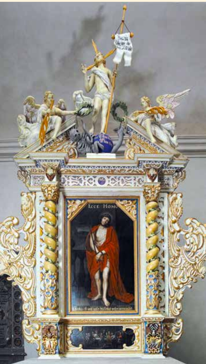
Altarretabel nach der Restaurierung; Foto: Hans Bach

1680/81 wurde die Kanzel seines Großvaters von ca. 1640 umgestaltet. So musste der Fuß verkürzt werden, weil der Kirchenfußboden angehoben wurde, und andererseits kam ein neuer Schalldeckel hinzu, der wesentlich höher ist als der ursprüngliche. Die gestalterisch sehr aufwändige bildhauerische Ausformung des neuen Schalldeckels ist bemerkenswert, weil er wie eine Bekrönung wirkt und zugleich direkt in den Himmel verweist. Der „Heilige Geist“, in der traditionellen Gestalt einer Taube vermutlich des alten Schalldeckels, ist in die Umgestaltung der Taufe übergegangen. Der neue Schalldeckel trägt seither an dessen Stelle aber die Ermahnung für jeden Pfarer: „Ruffe getrost, schone nicht, erhebe deine Stim, wie eine Posaune, und verkündige meinem Volck ir übertreten, und dem Hause Jacob ire Sünde. Jes. 58.“