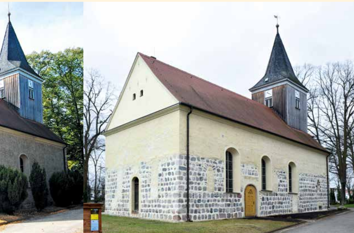
Dorfkirche Groß Glienicke nach der Putzabnahme und Neuverfugung