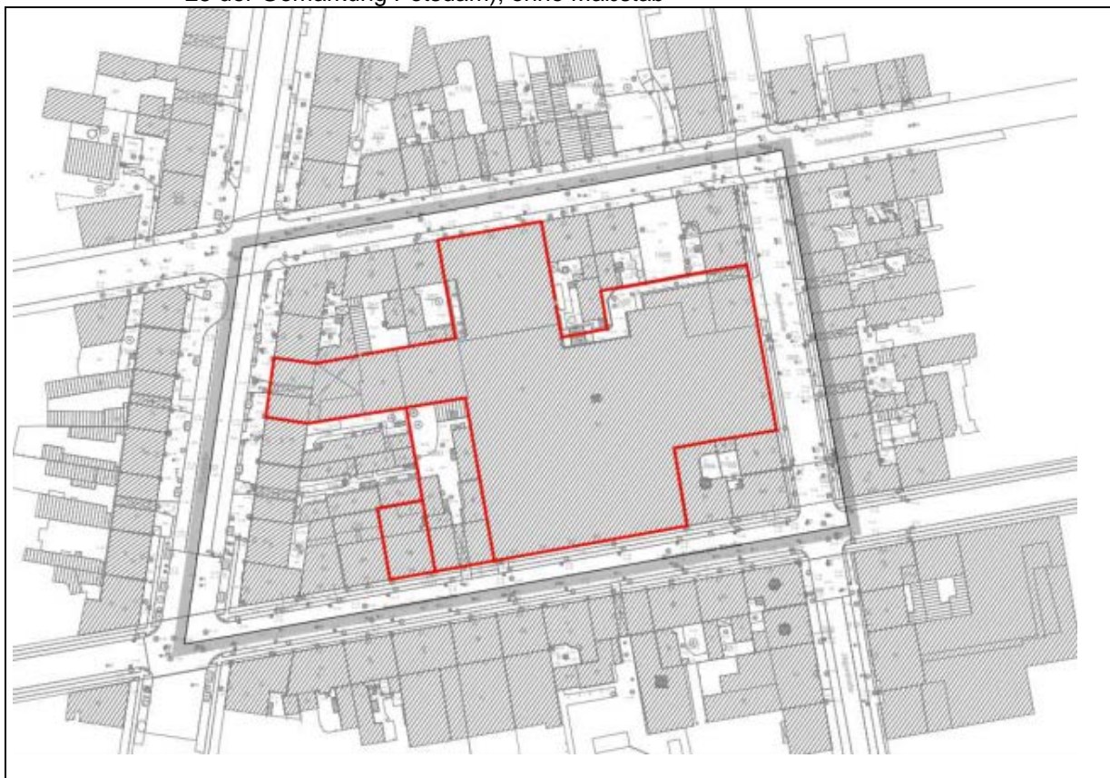
Abbildung 2: Untersuchungsbereich der Biototypenkartierung und Einschätzung artenschutzrechtlicher Belange (Grundstücke Brandenburger Straße 53 und 54; Flurstück 1566, Flur 25 der Gemarkung Potsdam); ohne Maßstab

Die überwiegend zwei- bis fünfgeschossigen Gebäude sind saniert, augenscheinlich in gutem Zustand und unterliegen zum größten Teil dem Denkmalschutz.