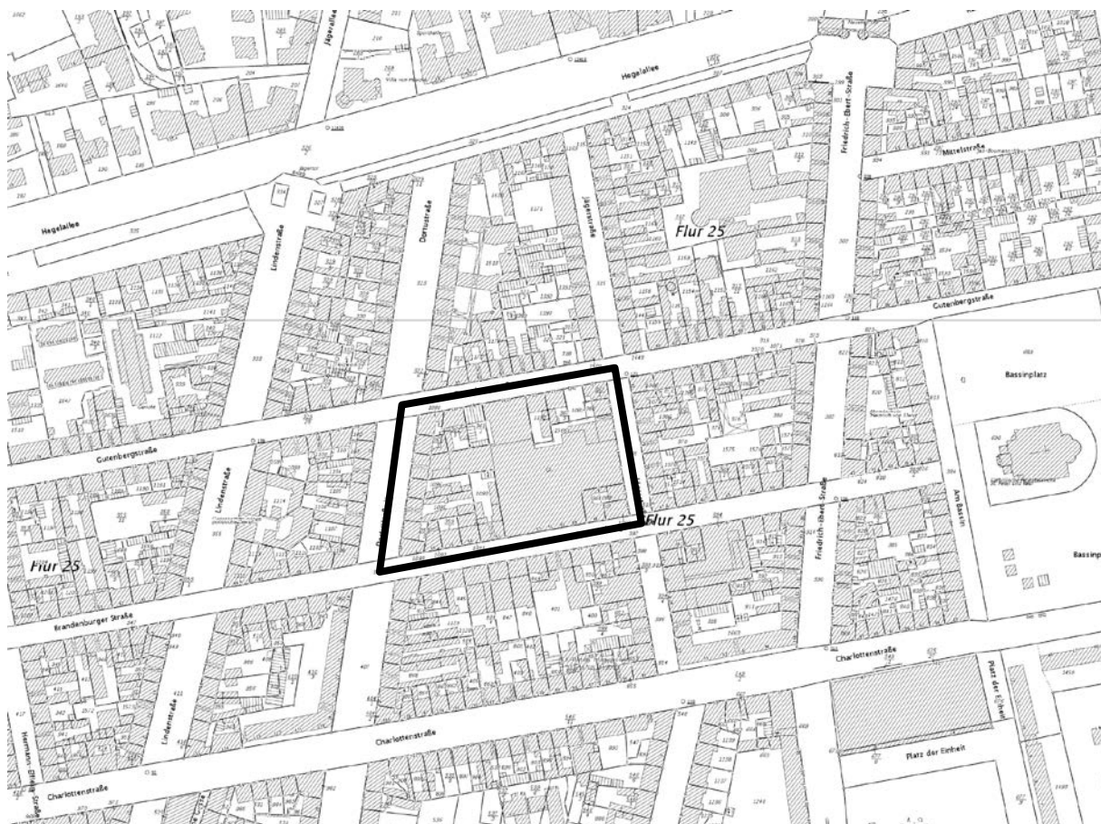
Abbildung 1: Übersichtsplan Potsdam, 2. Barocke Stadterweiterung, ca. 1: 5.000

Das Bebauungsplangebiet befindet sich in der Mitte der 2. Barocken Stadterweiterung, dem heutigen Zentrum Potsdams, im Block 15. Das Kaufhaus steht mit seiner denkmalgeschützten Hauptfront direkt an der Brandenburger Straße, der in den 1970er Jahren zur Fußgängerzone umgebauten Hauptachse des Stadtteils. Sie ist die wichtigste Einkaufs- und Geschäftsstraße der Stadt und verbindet den Bassinplatz im Osten mit dem Brandenburger Tor im Westen. Die räumliche Abgrenzung des Geltungsbereiches resultiert aus dem sich auf die Grundstücke des gesamten Blockes beziehenden Veränderungspotential und dessen Auswirkungen auf die Bebauung im Block.