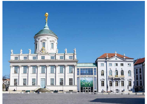
Potsdam Museum Forum für Kunst und Geschichte

Die Museumskombikarte ist für 14 Euro in den einzelnen Museen und Touristinformationen erhältlich, sie ist ab dem ersten Besuch ein Jahr gültig.