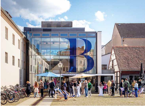
Brandenburg Museum für Zukunft, Gegenwart und Geschichte

Erleben Sie Kultur, Film, Natur und Geschichte aus Potsdam, Brandenburg und der Welt.