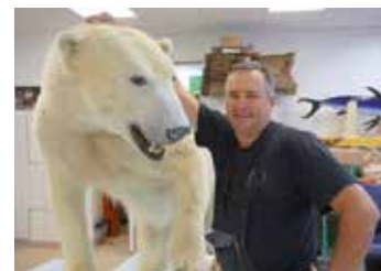
Eisbär ( Ursus maritimus )