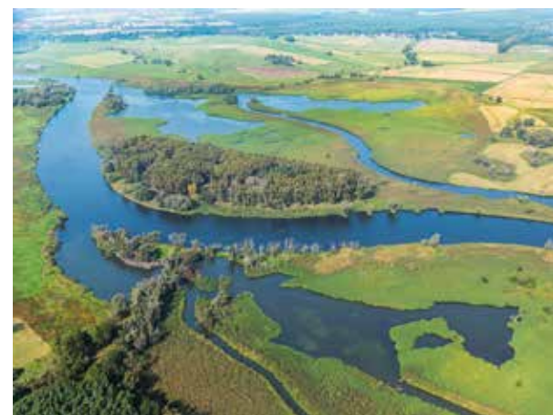
Klemens Karkow, 110 x 83 cm, 2014

Die Leihgabe des NABU Bundesverbandes präsentiert Arbeiten der Fotografen Klemens Karkow und Parwez Mohabat-Rahim.