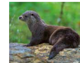
Fischotter ( Lutra lutra )