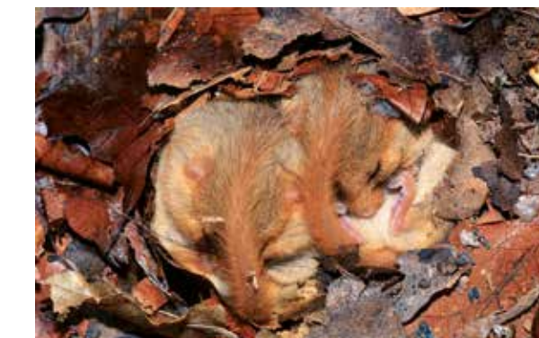
Haselmäuse ( Muscardinus avellanarius ) im Winterschlaf