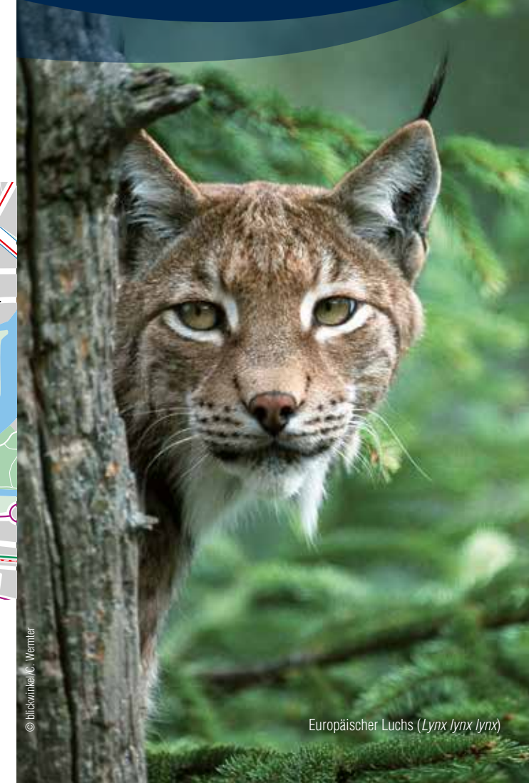
Europäischer Luchs ( Lynx lynx lynx )