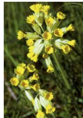
Echte Schlüsselblume ( Primula veris )