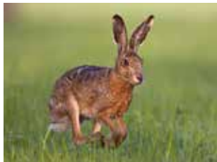
Europäischer Feldhase ( Lepus europaeus )

Mittwoch, 11., 18. und 25. Juli, 9–10 Uhr Donnerstag, 12., 19. und 26. Juli, 9–10 und 10:30–11:30 Uhr