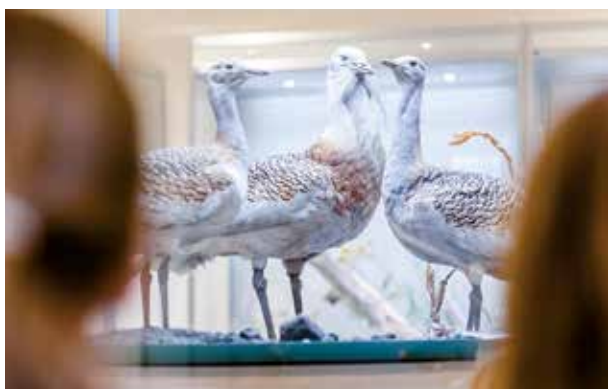
Großtrappen ( Otis tarda )

An zahlreichen Originalpräparaten wird die Artenvielfalt und ihr Wandel im Land Brandenburg vorgestellt. Lernen Sie Wolf, Elch und Großtrappe hautnah kennen.