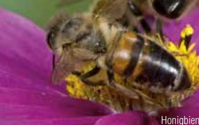
Honigbiene ( Apis mellifera )