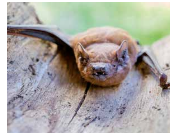
Großer Abendsegler ( Nyctalus noctula )