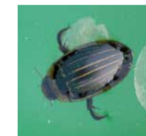
Schwimmkäfer ( Hydaticus continentalis )