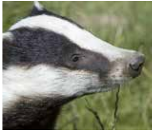
Europäischer Dachs ( Meles meles )