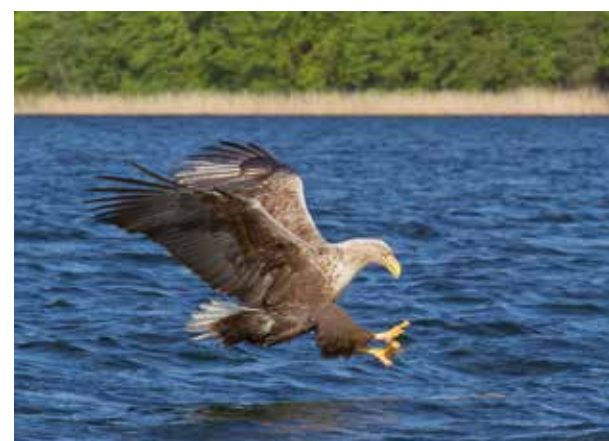
Seeadler ( Haliaeetus albicilla )

Die Leihgabe des NABU Bundesverbandes präsentiert Arbeiten der Fotografen Klemens Karkow und Parwez Mohabat-Rahim.