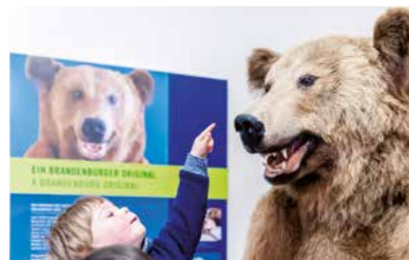
Braunbär ( Ursus arctos )

Ab 5 Jahren geeignet. Führung ist im Museumseintritt enthalten. 20 Teilnehmende. Telefonische Anmeldung erwünscht: 0331 289-6707.