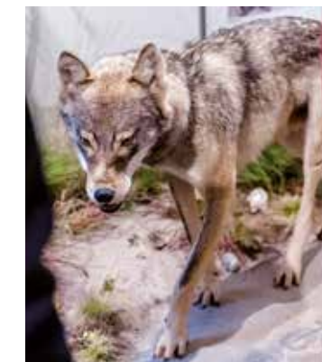
Europäischer Grauwolf ( Canis lupus lupus )

Tiere stehen im evolutionären Wettkampf um das Überleben. Welche Strategien haben Jäger wie der Wolf und Gejagte wie das Reh dafür entwickelt? Erfahren Sie mit welchen Tricks in der Tierwelt gekämpft wird.