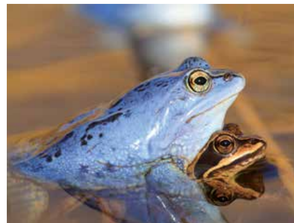
Moorfrösche ( Rana arvalis )

Die Leihgabe des NABU Bundesverbandes präsentiert Arbeiten der Fotografen Klemens Karkow und Parwez Mohabat-Rahim.