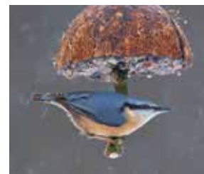
Kleiber ( Sitta europaea )