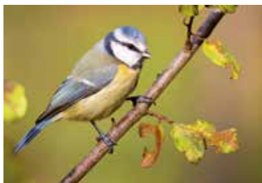
Blaumeise ( Cyanistes caeruleus )

Dienstag, 6. März, 14:30–16 Uhr Grüne Stunde für Erwachsene: Von Betrügnern und Blendern