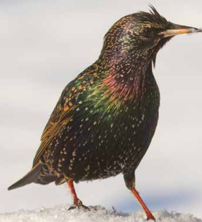
Vogel des Jahres 2018: Der Star ( Sturnus vulgaris )