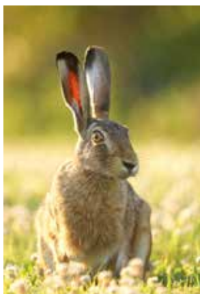
Feldhase ( Lepus europaeus )

Samstag, 31. März, 10–15 Uhr Oster-Spezial für die ganze Familie