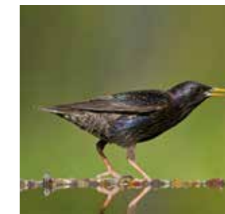
Star ( Sturnus vulgaris )