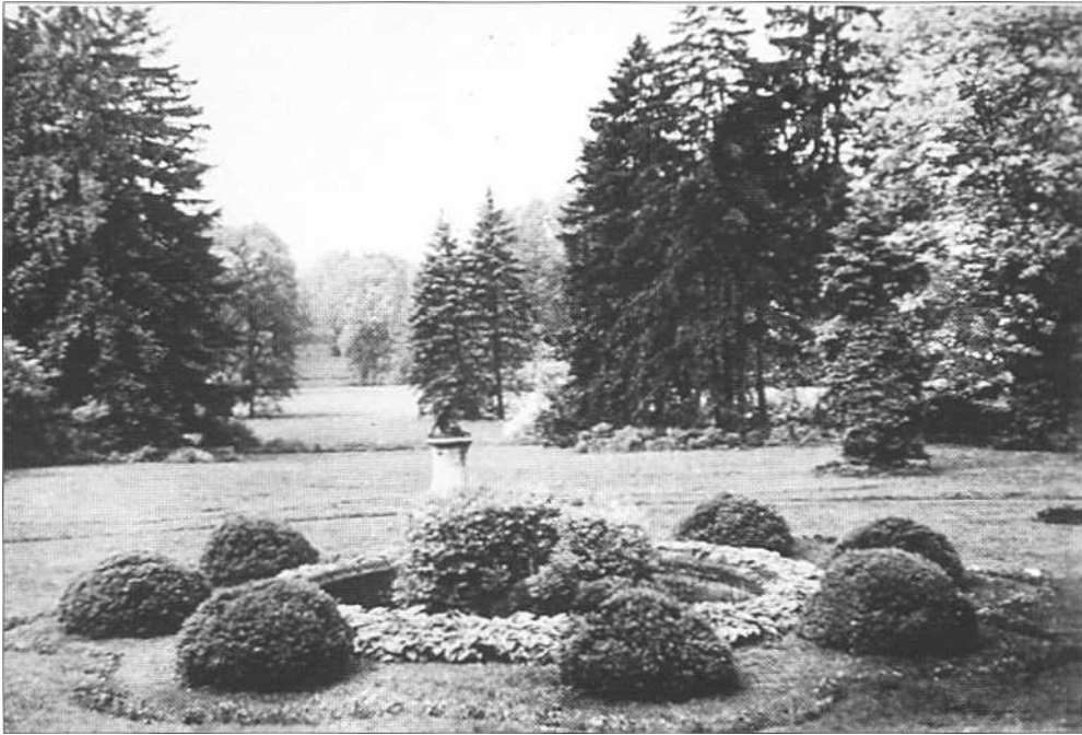
Abb. 4: Blick vom Herrenhaus über den pleasure ground nach Westen durch die große Sichtachse.

liche Probleme erzwangen 1938 den Verkauf des Gutes an den Fiskus. Das Herrenhaus brannte im Herbst 1945 ab.