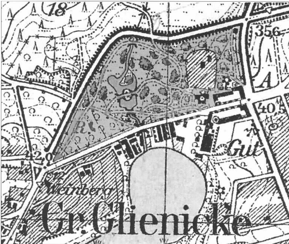
Abb. 2: Plan vom Gutsark Groß Glienicke, Ausschnitt aus der Topografischen Karte 1: 25.000, Ausgabe 1936

kirchen und die Reste der Gutsanlagen meist die einzigen Bezugspunkte zur lokalen Geschichte dar. So ist es auch im vorliegenden Fall der „Groß Glienicker Kreis“ (seit 2003: e.V.), der Spendengelder sammelt, um das Potsdamer Tor des ehemaligen Gutes Groß Glienicke zu retten, und der wiederholt Aufräumarbeiten im dazu gehörenden Park vornahm.