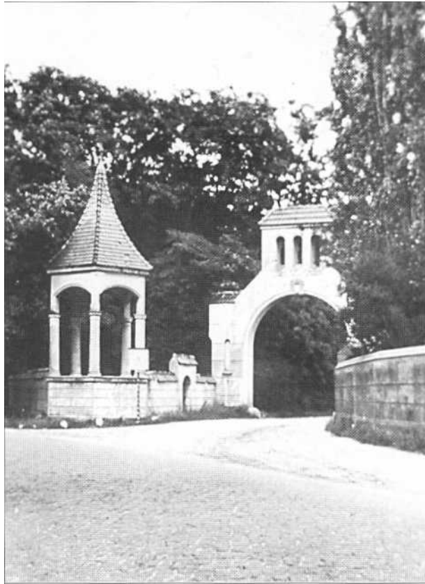
Abb. 3: Blick auf das Potsdamer Tor von Westen her. Die Neugierde trägt noch ihr charakteristisches Zeltdach.

Dieses alles fügt sich in der Erinnerung zu einem Bild einer stattlichen Gutsanlage mit großem Wirtschaftshof, einem repräsentativen Herrenhaus und „schönen Parkanlagen“, wie noch 1939 Paul Ortwin Rave zu berichten wusste, zusammen, die alle Kriegswirren überstanden hatte und die erst infolge der Teilung Deutschlands zerstört wurde. „Nur das Bild noch lebt“, könnte man meinen. Dank des Fleißes der Ortschronisten (zuletzt das Ehepaar Laude) konnten jedoch zahlreiche Erinnerungen und Fotos zusammengetragen werden, die es uns ermöglichen, das „lebende Bild“ mit Hilfe einer genauen Untersuchung des Geländes, einer Quellen- und Literaturlauswertung sowie der Auswertung der historischen Bilder zu verifizieren. Einige Fotos aus den 20er und 30er Jahren des 20. Jahrhunderts werden in diesem