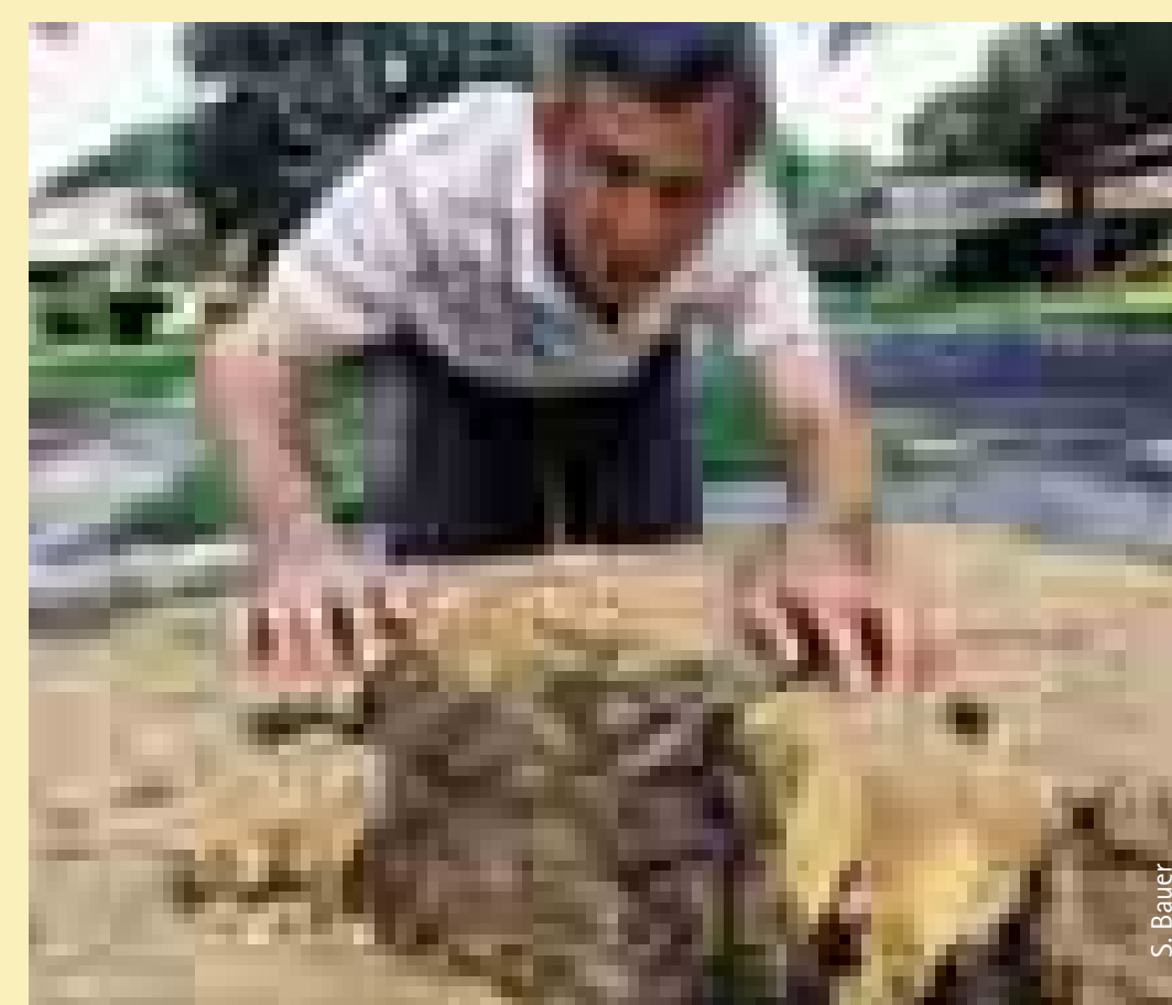
Von Termiten zerfressener Baum Tree to erode by termites

Moderne Bananenfrachtschiffe benötigen heute nur zwei Wochen, um den Atlantik zu überqueren und ihre verderbliche Fracht von Costa Rica nach Hamburg zu transportieren. Die Innenräume sind auch für sechs- und achtbeinige blinde Passagiere angenehm klimatisiert, und ein Salzwasserkontakt ist unter normalen Bedingungen völlig ausgeschlossen.