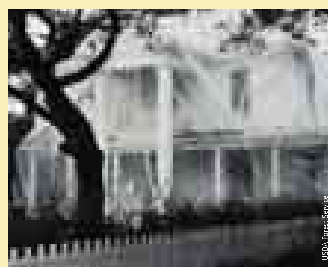
Mit Termiten befallenes Haus wurde hermetisch verschlossen House seized with termites was hermetic occlusive

Hölzerne Verpackungen und Transportpaletten sind im internationalen Warenverkehr ein Verbreitungsmedium für Insekten. Nach dem Entladen wird das Holz oft im Umfeld des Wareneempfängers gelagert. Dadurch werden die weitere Entwicklung mitgereister Larven und der Schlupf der entwickelten Insekten sowie die erfolgreiche Ansiedlung einer Gründerpopulation möglich. Durch den Import von Holz und Holzprodukten wurden nach Mitteleuropa 49 Insektenarten eingeschleppt. Viele Arten sind nicht winterhart und nur in der Lagerhaltung anzutreffen, doch einige Arten, wie der als Holzschädling gefürchtete ostasiatische Braune Splintholzkäfer ( Lyctus brunneus ), siedelten sich in Europa an.