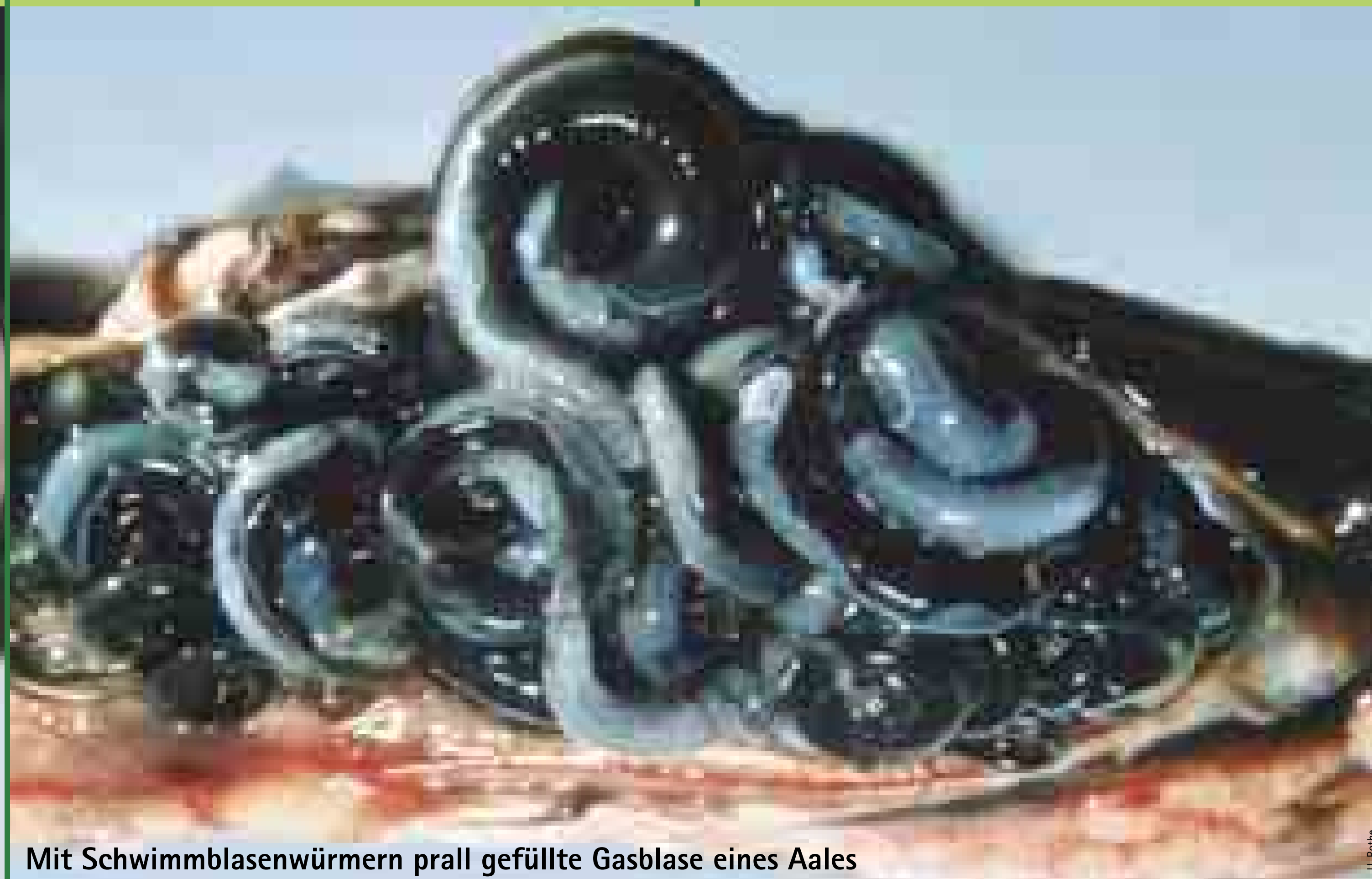
Mit Schwimmblasenwürmern prall gefüllte Gasblase eines Aales