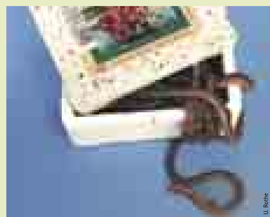
Kanadische Tauwürmer aus dem Fachhandel Canadian Night Crawlers from specialized trade

Um 1980 wurde ein Wurm ( Anguillicola crassus ) mit Fischimporten aus Asien nach Europa eingeschleppt, der in Schwimmblasen von Aalen lebt. Der Europäische Aal ( Anguilla anguilla ) wird von ihm weitaus stärker befallen, als seine asiatischen Verwandten. Der Wurm breitete sich in 15 Jahren in allen Aalpopulationen Europas, Nordafrikas und Amerikas aus. In den Gewässern um Berlin tragen heute über 90 Prozent der Aale den Parasiten in sich - und er verändert sich. Wissenschaftler vermuten inzwischen, dass beim Schwimmblasenwurm ein rasanter Anpassungsprozess abläuft. Sie haben derzeit die einmalige Möglichkeit, einen solchen Prozess zwischen Parasit und Wirt in der Natur zu verfolgen. Seit Jahren werden Schädigungen und Veränderungen der Schwimmblase des Aales festgestellt. Ob die Wanderung der Aale zu den Laichplätzen in die Sargassosee dadurch behindert wird, ist nicht nachgewiesen. Zwei weitere ostasiatische Wurmart, die ebenfalls den Aal befallen, breiteten sich innerhalb weniger Jahre ebenfalls aus. Heute sind auch sie in fast allen Aalen zu finden, doch die Auswirkungen dieser exotischen Würmer auf die Aalpopulationen sind unbekannt.