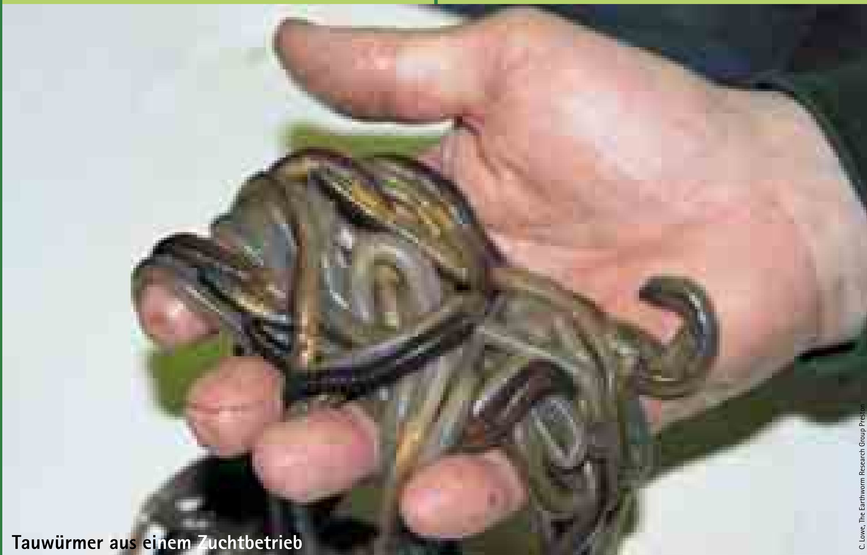
Tauwürmer aus einem Zuchtbetrieb