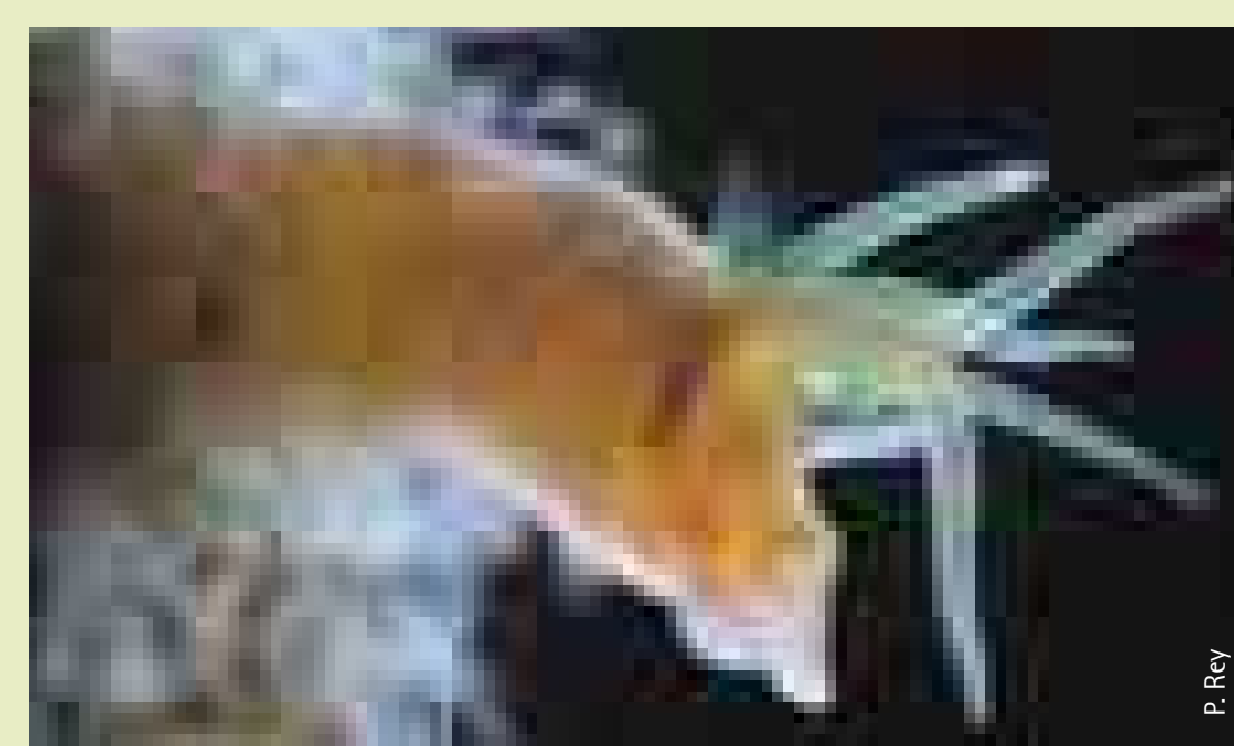
Hypania invalida – ein neuer Borstenwurm in Deutschland Hypania invalida – a new Bristle worm in Germany