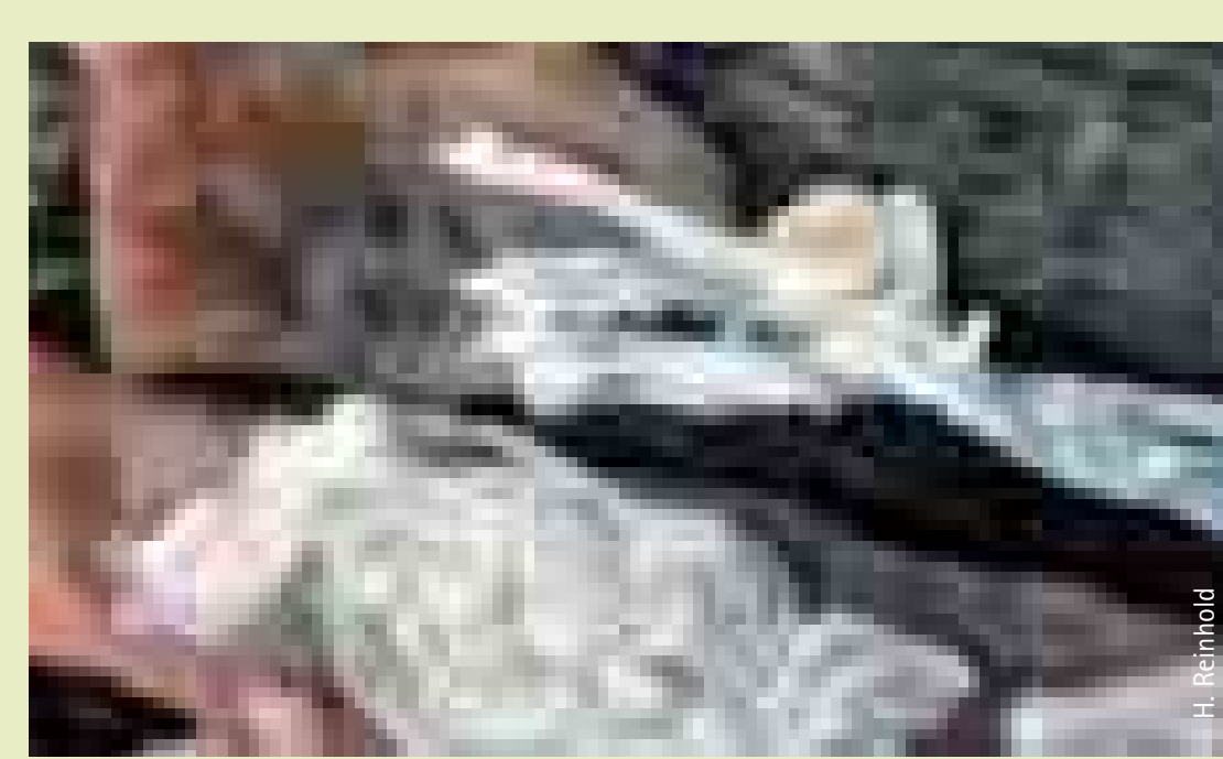
Massenbefall mit asiatischen Bandwürmern ( Bothriocephalus ) im Karpfen Mass infected of Carp with Asian Tape-worms ( Bothriocephalus )