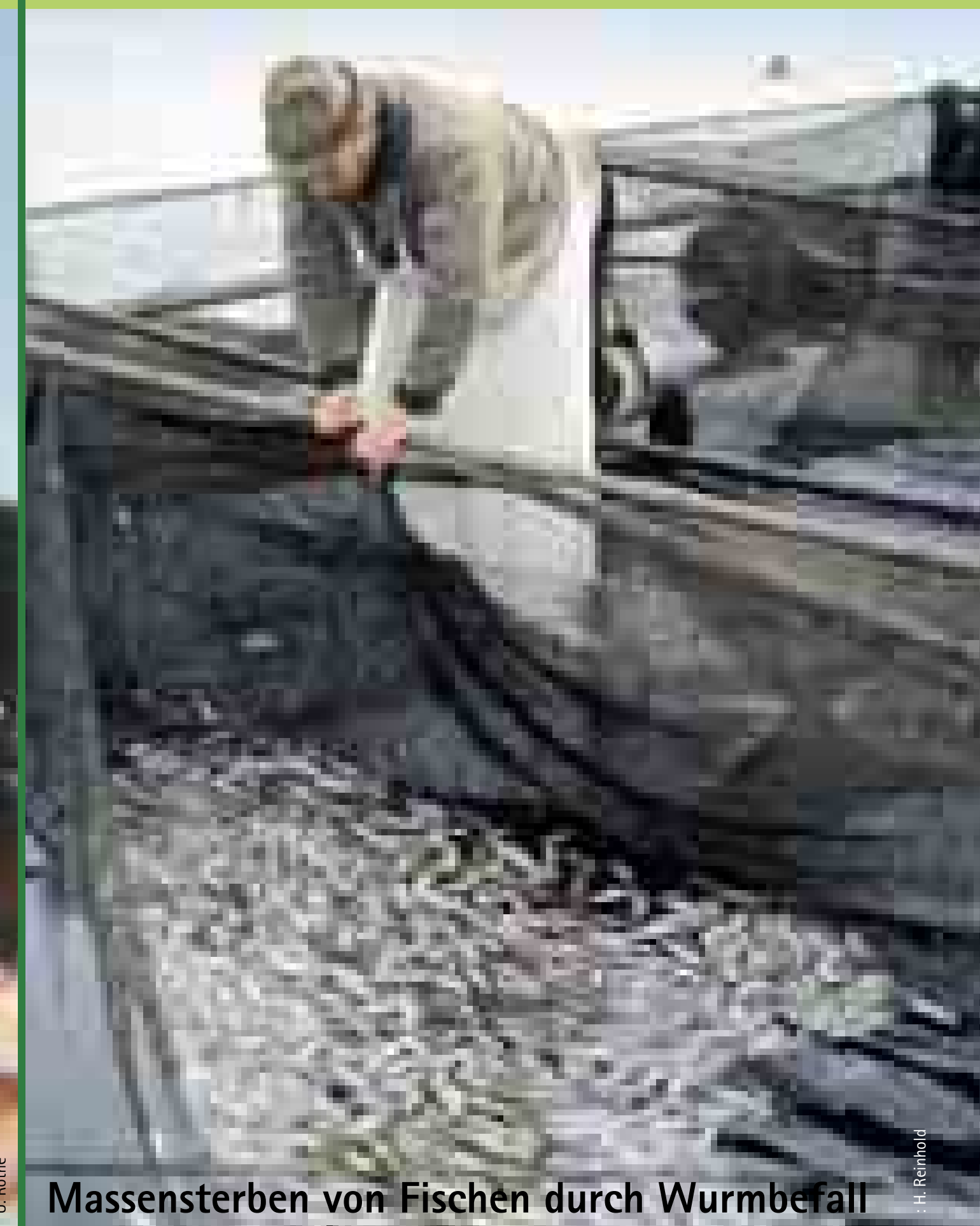
Massensterben von Fischen durch Wurmbefall