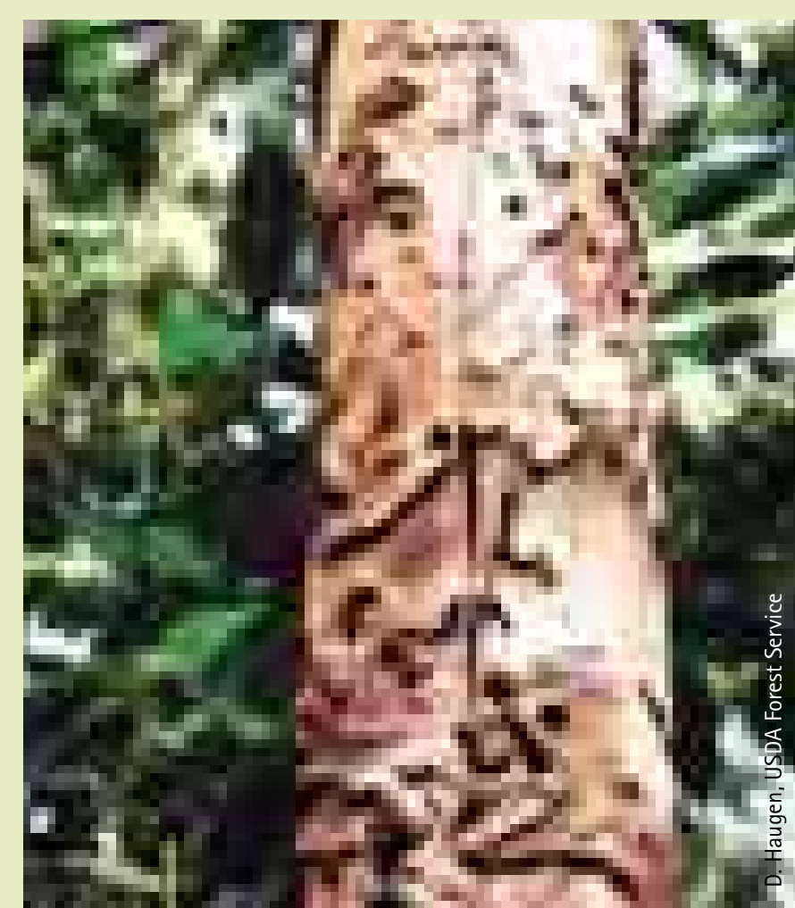
Schäden durch Larven des Asiatischen Laubholzbockkäfers Stem with larval damages of the Asian Longhorned Beetle

Die Gemeine Rosskastanie ( Aesculus hippocastanum ) stammt aus Vorderasien und von der südlichen Balkanhalbinsel. Seit dem Mittelalter wird sie in weiten Teilen Europas als imposanter Park- und Schattenbaum sowie als Futterbaum im Wald angepflanzt. Anfang der 1980er Jahre wurde die winzige Rosskastanien-Miniermotte ( Cameraria ohridella ) erstmals in Mazedonien entdeckt. Über Luftströmungen und durch den Verkehr breitete sie sich schnell aus und erreichte 1998 Berlin. Die Motte gehört zu einer Gattung von Kleinschmetterlingen, die hauptsächlich in Nordamerika und Ostasien verbreitet ist. Sie befällt in Europa überwiegend die Gemeine Rosskastanie. Die Raupen fressen (minieren) in den Blättern. Als Folge trocknen die Blätter aus, verfärben sich braun und fallen bei starkem Befall bereits im Frühsommer ab.