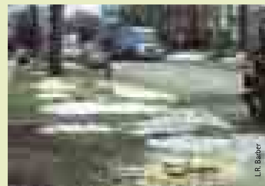
Notfällung in Chicago Emergency felling in Chicago