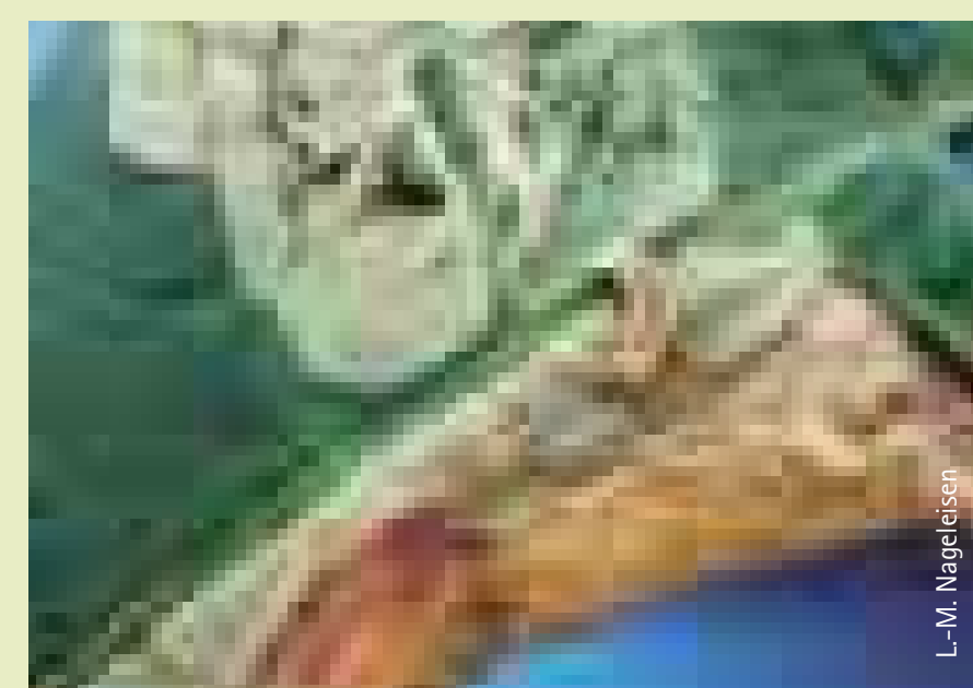
Miniermottenlarve auf zerstörtem Blatt Larva of the Horse Chestnut Leaf-Miner on the host