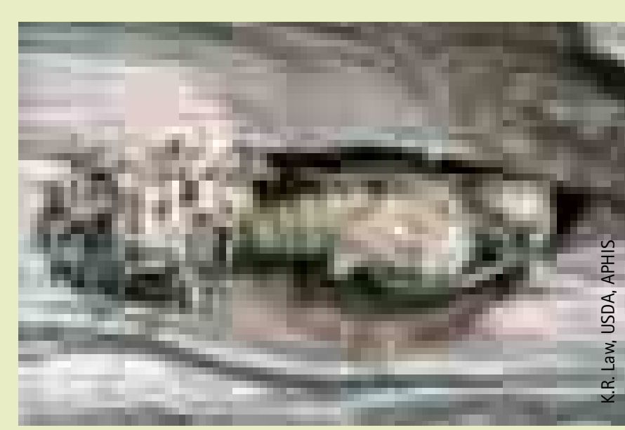
Puppe des Asiatischen Laubholzbockkäfers Free pupa of the Asian Longhorned Beetle