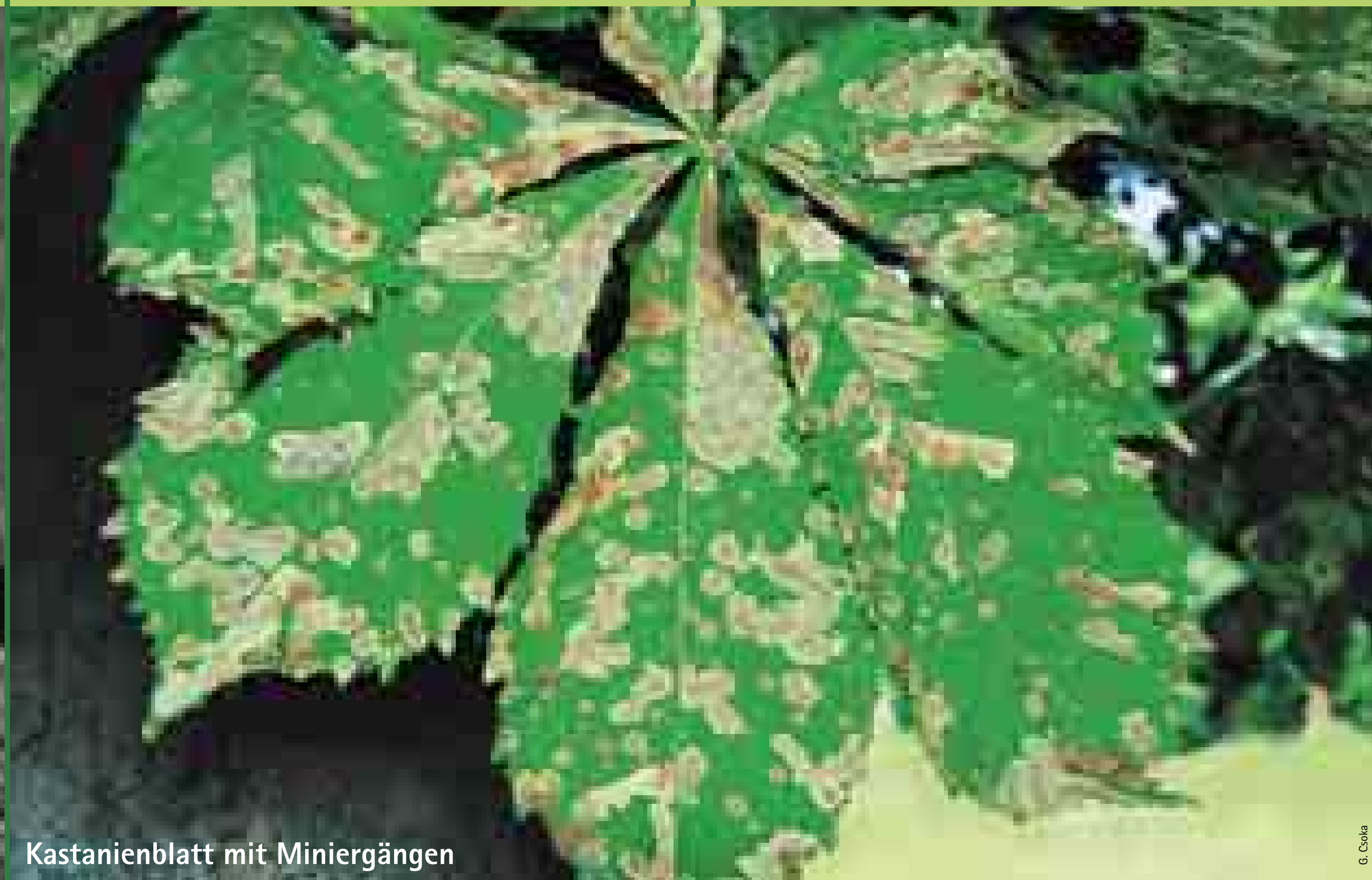
Kastanienblatt mit Miniergängen