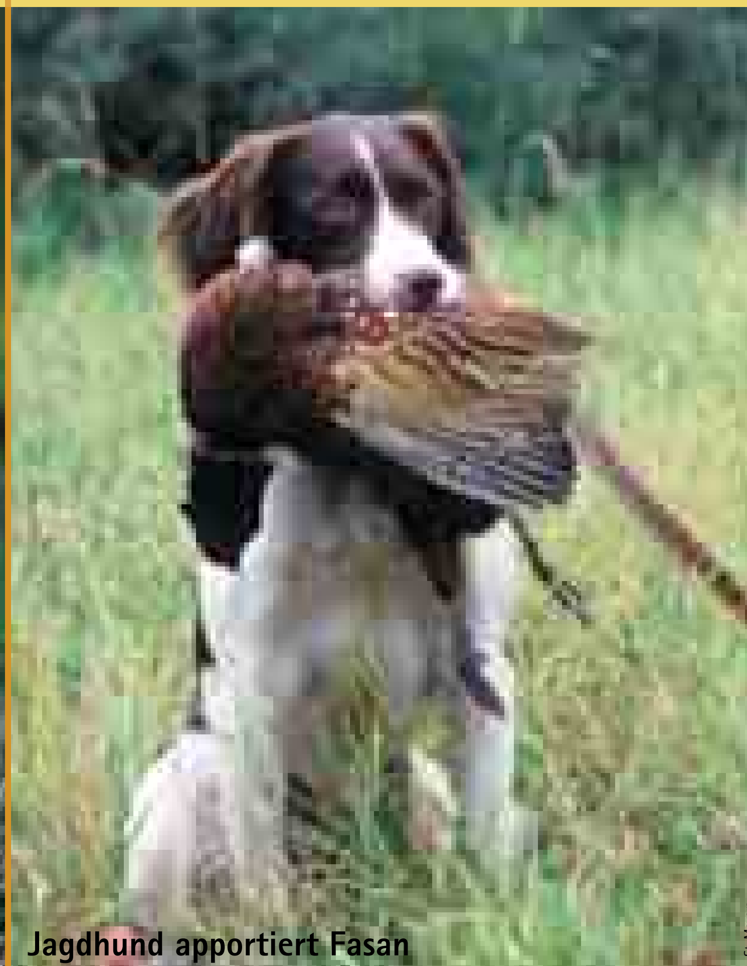
Jagdhund apportiert Fasan