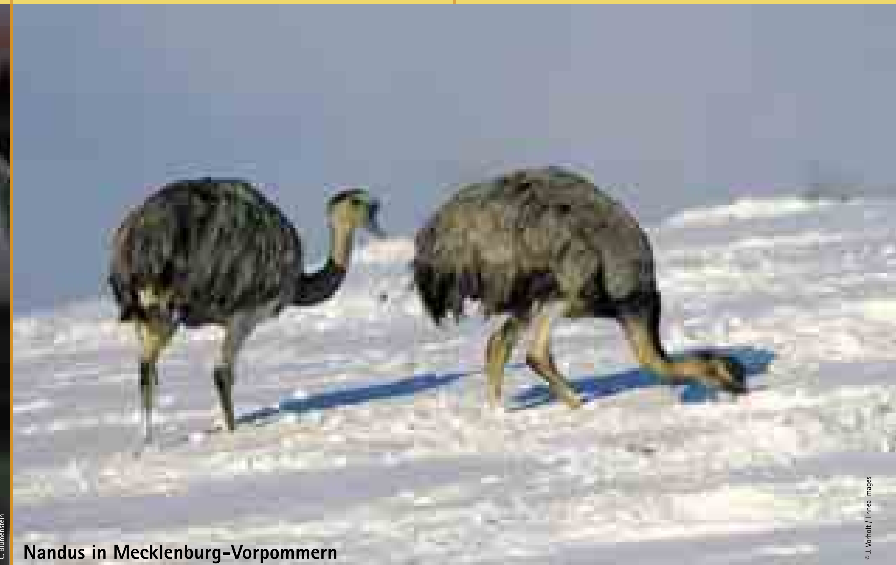
Nandus in Mecklenburg-Vorpommern