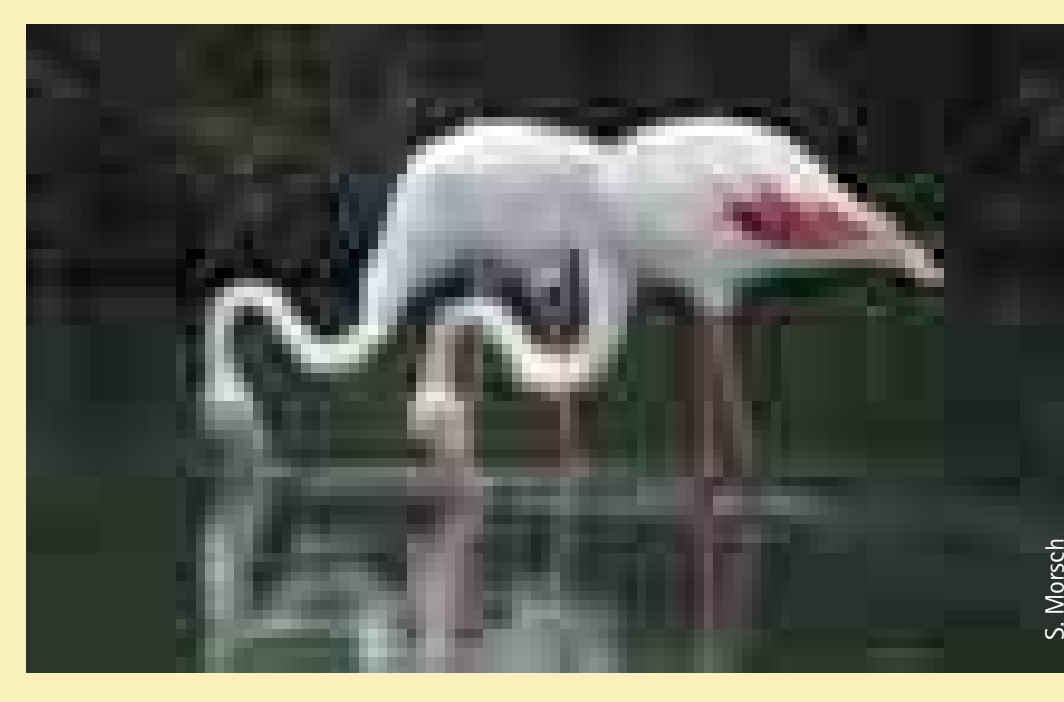
Rosaflamingo Greater Flamingo

Schon lange versucht man, exotische Vögel in Parks freilebend zu halten. Besonders seit dem 18. Jahrhundert wurden bunte Fasane und andere Hühnervögel in vielen Ländern ausgesetzt. Nur wenige dieser Ansiedlungen sind bis heute erfolgreich. Deshalb gibt es in Großbritannien nur kleine Bestände des aus China stammenden Goldfasans ( Chrysolophus pictus ) und des ostasiatischen Diamantfasans ( Chrysolophus amherstiae ).