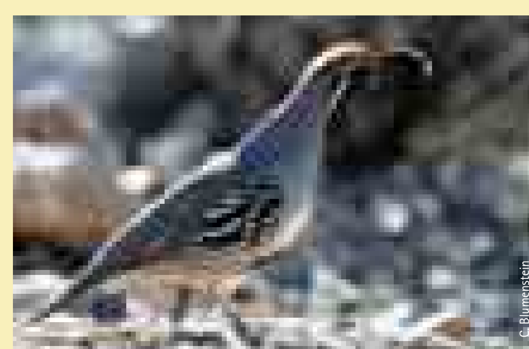
Kalifornische Schopfwachtel Californian Quail