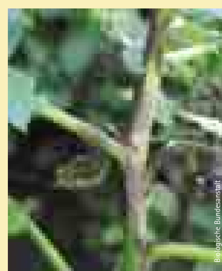
Kartoffelpflanze mit Braunfäule infiziert Potato plant infected with Late Blight