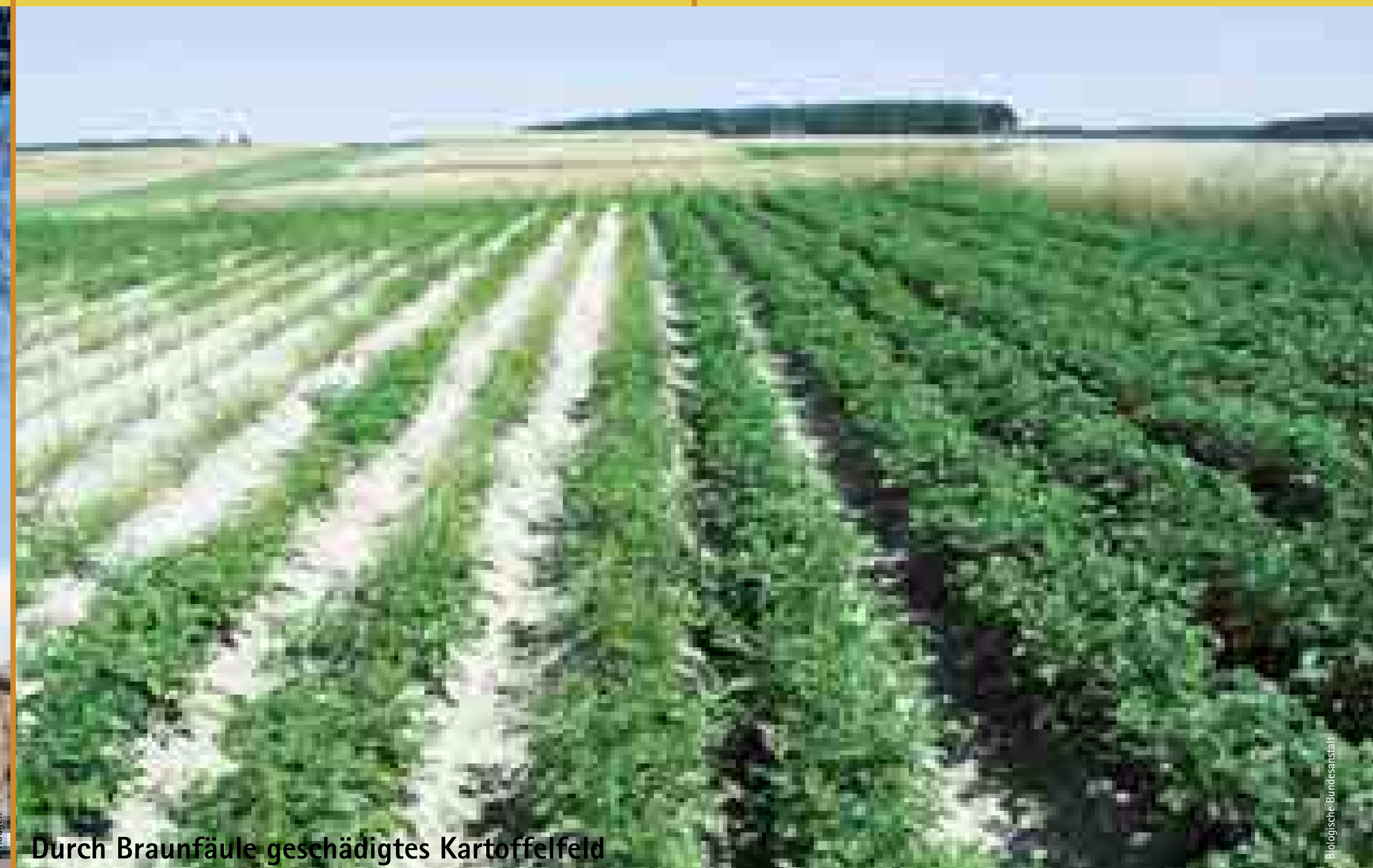
Durch Braunfäule geschädigtes Kartoffelfeld