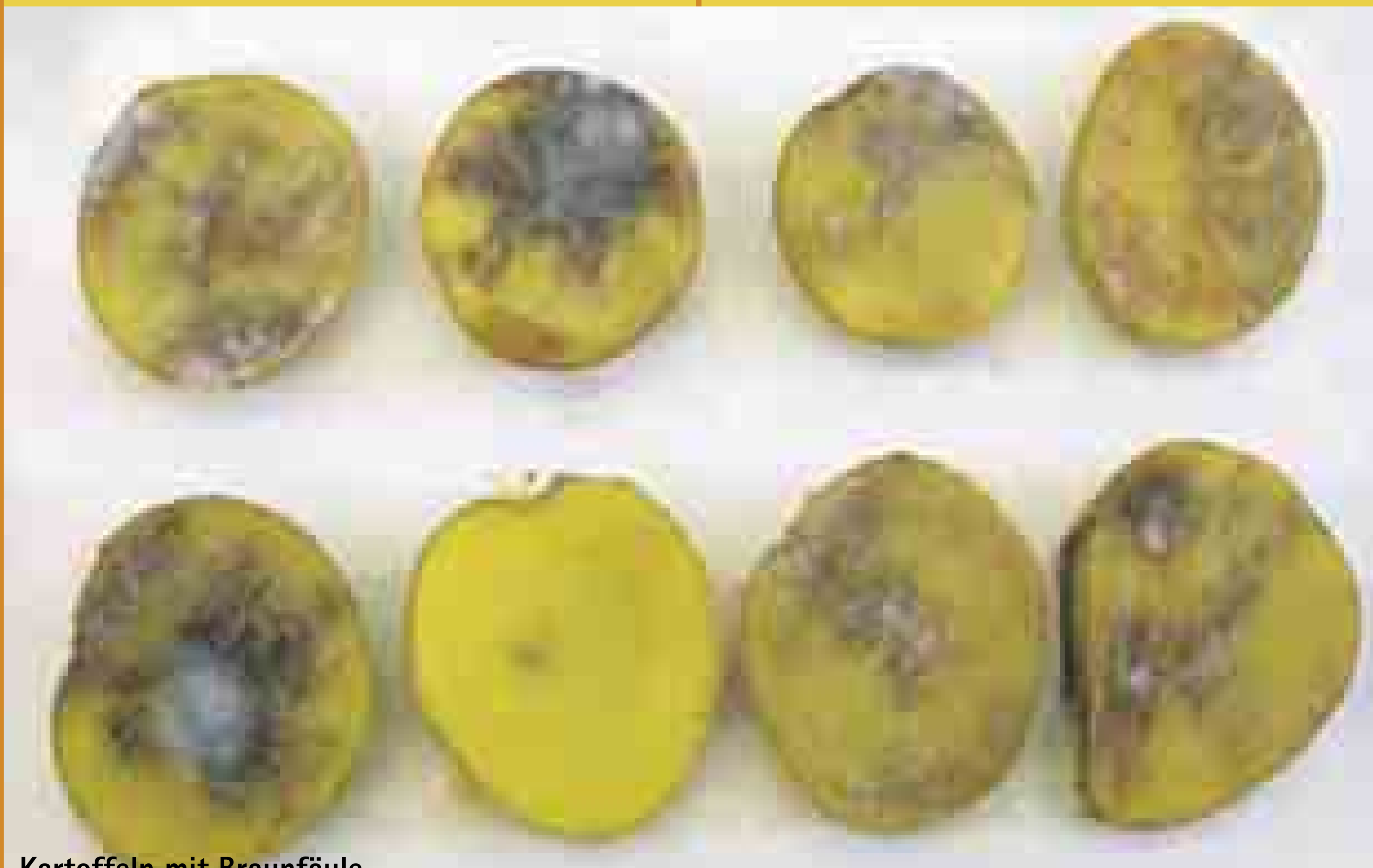
Kartoffeln mit Braunfäule