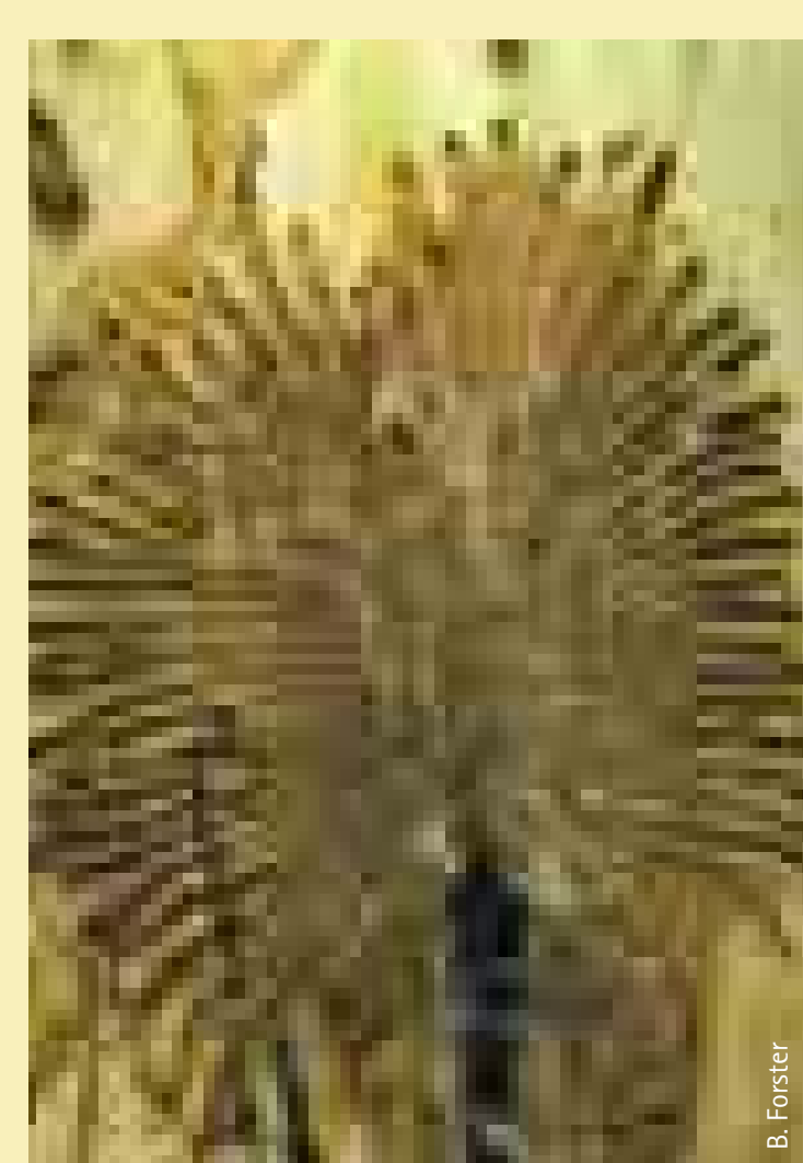
Schadbild des Ulmensplintkäfers Damage patterns of the Large Elm Beetle