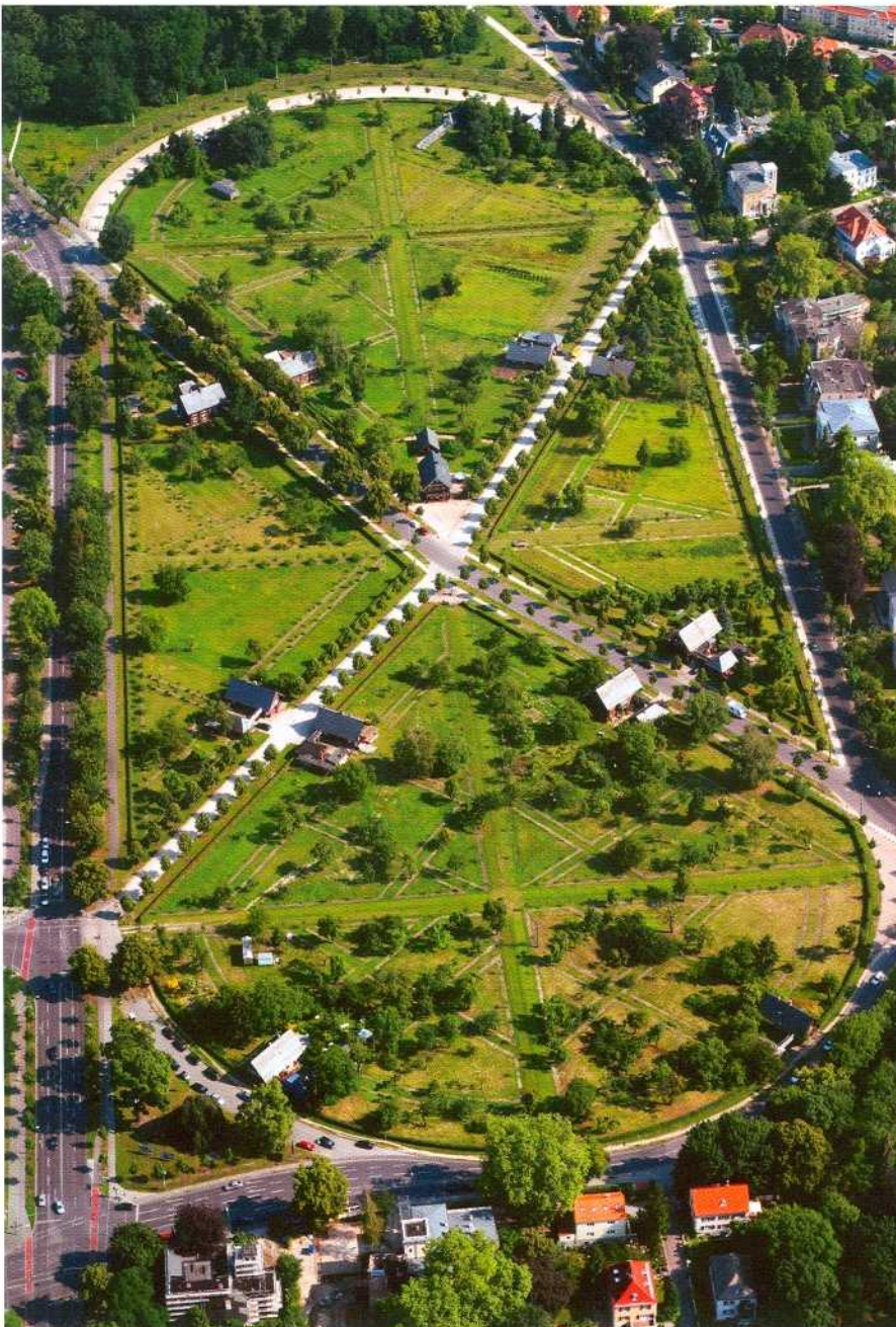
Russische Kolonie Alexandrowka.