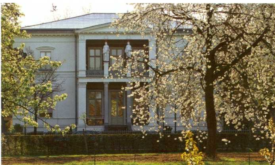
Alexandrowka. Blick auf Villa Fischbach. Puschkinallee 5. Foto: Hans Bach, 2001

Gestaltungsprogramm bis ins 20. Jahrhundert weiter. So wurden die zahlreichen morphologischen Vorzüge der Potsdamer Landschaft durch Gärten, Parks, gestaltete Wald- und Uferpartien, mehrere Schlossanlagen und Einzelbauwerke betont und damit aus der traditionellen Kulturlandschaft herausgehoben. Bis heute verbinden Alleen und zum Teil kilometerlange wechselseitige Sichtbeziehungen die prägenden Bauwerke und/oder Aussichtspunkte in die Landschaft miteinander und ergeben durch die bewusst komponierten Bildfolgen große begehbare „Landschaftsgemälde“. So entstand ein Gesamtkunstwerk in der Einheit planmäßiger Stadtentwicklung sowie bau-, bild- und gartenkünstlerischer Schöpfungen in einer Synthese mit der umgebenden überformten Landschaft des 17. bis 20. Jahrhunderts. Die Ausdehnung dieser „Potsdamer Kulturlandschaft“ ist im Wesentlichen identisch mit dem von Peter Joseph Lenné 1833 entworfenen „Verschönerungs-Plan“. 5 In diese definierte Raumeinheit ist das Welterbedenkmal eingebettet und umfasst gewissermaßen den wertvollsten Kernbereich all dessen.