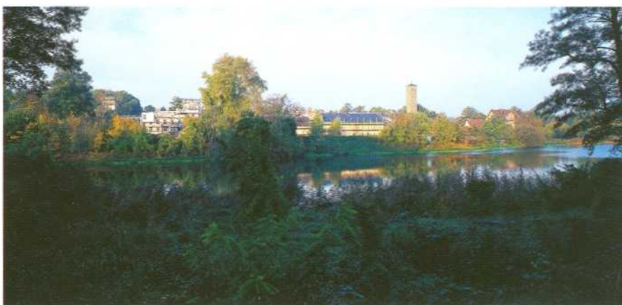
Bornstedt, Blick auf das Krongut in Bornstedt.

Die barocke Residenzstadt Potsdam mit den königlichen Schlössern und Gärten ist im 19. Jahrhundert von den preußischen Königen zu einer außergewöhnlichen Kulturlandschaft planmäßig erweitert und gestaltet worden. Grundlage war Peter Joseph Lennés Gesamtplan zur Verschönerung der „Insel Potsdam“ inmitten der Flusslandschaft der Havel. Unter Ausnutzung der besonderen Topografie wurden danach die Stadt und die angrenzenden königlichen Parkanlagen durch gestaltete Landschaftsteile und Anlagen zu einer