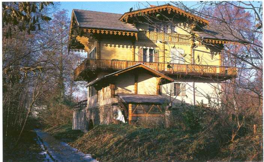
Klein-Glienicke, Louis-Nathan-Allee 5, Wohnhaus im Schweizerhausstil, Mitte 19. Jahrhundert.

Die „Convention for the Protection of the World Cultural and Natural Heritage“ sieht in Artikel 4 vor, dass jeder Vertragsstaat selbst für die Erhaltung des Welterbedenkmal auf seinem Hoheitsgebiet ver-