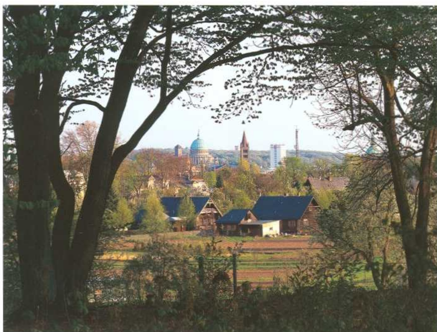
Blick vom Kapellenberg über die russische Kolonie Alexandrowka zur Kuppel der Nikolaikirche.

Die Landeshauptstadt Potsdam ist aufgrund ihres Denkmalbestandes weit über die Landesgrenzen, ja weltweit, bekannt. Der Denkmalbestand der Stadt umfasst im Jahr 2006 ca. 1534 Denkmalpositionen,