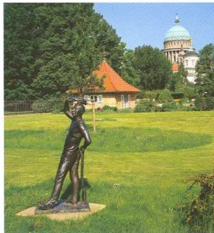
Freundschaftsinsel Potsdam – Blick auf die Nikolaikirche und das Alte Rathaus.