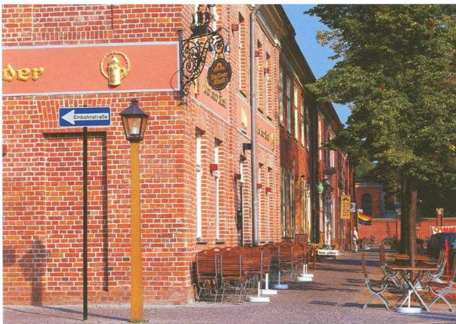
Holländisches Viertel – Mittel-Ecke Benkertstraße.