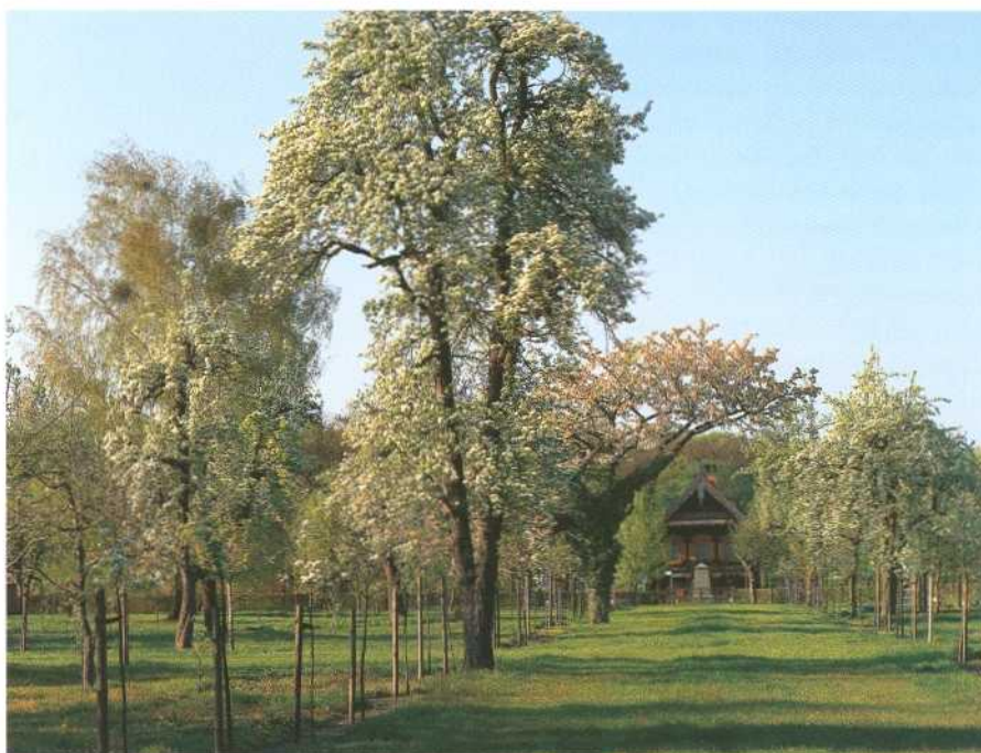
Blick durch eine Obstbaumallee der russischen Kolonie Alexandrowka zum zentralen Aufseherhaus.

Gemäß der Geschäftsverteilung der Stadtverwaltung ist der „Bereich Untere Denkmalschutzbehörde“ als Fachamt für entsprechend hoheitliches Handeln zuständig. Der Bereich übt die Funktion einer Genehmigungsbehörde aus. Denkmalschutz und Denkmalpflege umfassen im Wesentlichen die Bereiche Baudenkmalpflege, Gartendenkmalpflege und Bodendenkmalpflege. Zusätzlich ist der Bereich zuständig für die Unterhaltung von Sammlungen und bis zu einem gewissen